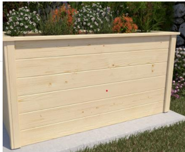
Topf 1- Anschaffungen